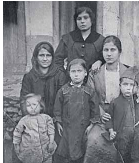
► Το 1921 έφθασαν στην περιοχή του Βόλου 5.300 πρόσφυγες και το 1922 12.000. Αρκετοί από αυτούς εγκαταστάθηκαν στην πόλη