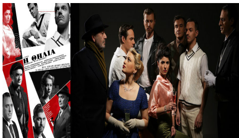
«Η ΘΗΛΙΑ» του Πάτρικ Χάμιλτον, στο Θέατρο Αργώ

«Η Θηλιά», το θεατρικό «θρίλερ δωματίου» του Πάτρικ Χάμιλτον, έγινε γνωστό στο κοινό και αγαπήθηκε μέσα από την κινηματογραφική διασκευή του από τον μετρ του είδους Άλφρεντ Χίτσκοκ. Το έργο, εμπνευσμένο από το αληθινό γεγονός της δολοφονίας ενός 14χρονου μαθητή από τους συμμαθητές του το 1924, έρχεται να μας θυμίσει πως ο άνθρωπος είναι προικισμένος εκ φύσεως με την αντίφαση - γεννιέται για να πεθάνει, μα έχει ως κύριο ένστικτο αυτό της επιβίωσης.