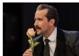
«Ιστορία χωρίς Όνομα» Θέατρο Αριστοτέλειον