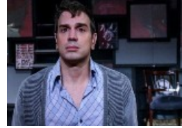
«Φυλές» της Νίνα Ρέν Θέατρο Αμαλία