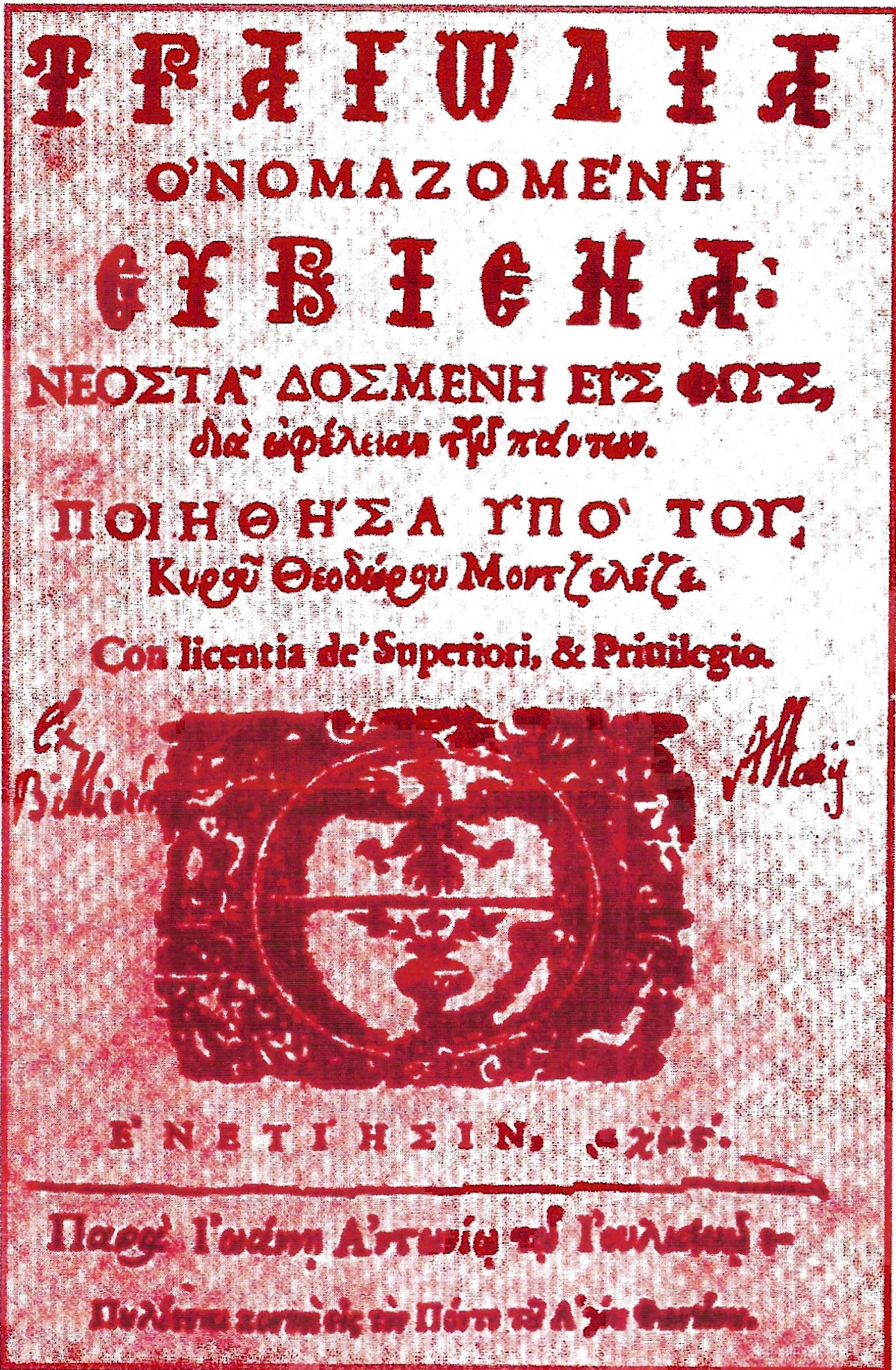
Το εξώφυλλο της Α' έκδοσης της Ευγένας (Βενετία, 1646).