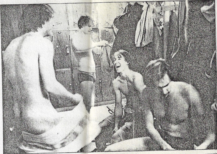
Μία φωτογραφία από την ομαδική έκθεση σουηδικής φωτογραφίας, που παρουσιάζεται στο Φωτογραφικό Κέντρο Αθηνών.