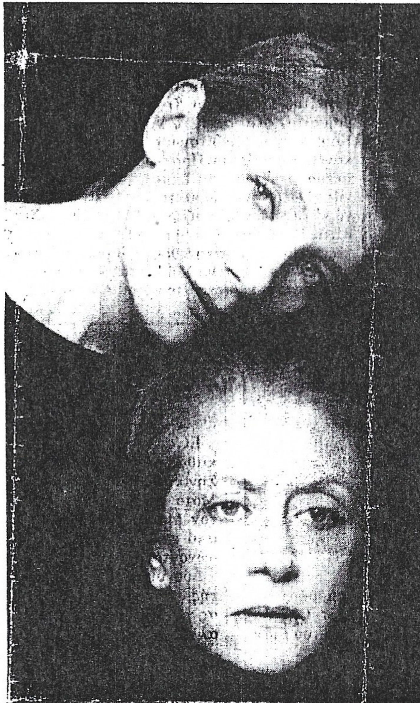
Υψηλάντη-Μπεμπεδέλη στην καταλυτική τους σύγκρουση συνθέτουν για το κοινό τους μια θεατρικότητα Καλή Νύχτα

Ευθύβολη η μελέτη στις ανθρώπινες σχέσεις που επιχειρεί η θεατρογράφος Μάρσα Νόρμαν, εξηγεί γιατί με το Βραβείο Πούλιτζερ τιμήθηκαν πριν από αυτή, ογκολιθικοί στυλοβάτες όπως ο Ο' Νηλ, ο Τένεσου Ουίλλιαμς, και ο Αλμπυ. Μάθημα Ζωής